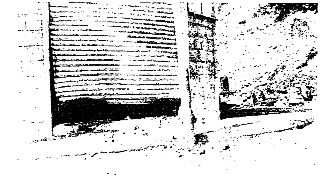
محل سبدي وصالح بعد انفجار عبوة تحت يابه